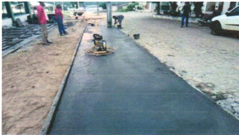
FOTO 01 – PAVIMENTAÇÃO EM CONCRETO, COM ESPESSURA DE 7CM, COM, ACABAMENTO FEITO UTILIZADO ALISADORA DE CONCRETO (HELICOPTERO), INCLUIDO TELA DE AÇO SOLDADA NERVURADA CA60, Q196 (3,11KG/M 2 ), DIAMETRO DO FIO 5.0 MM, LARGURA = 2,45 M, ESPAÇAMENTO DA MALHA 10CMX10CM