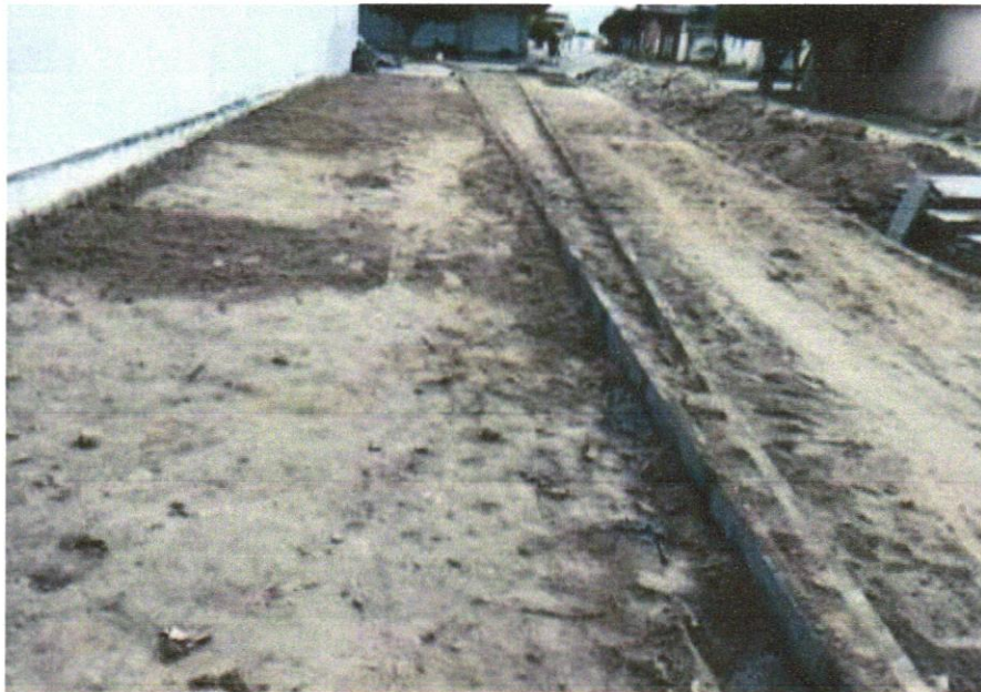
FOTO 06 – ASSENTAMENTO DE GUIA (MEIO-FIO) EM TRECHO RETO, CONFECCIONADA EM CONCRETO PRÉ-FABRICADO, DIMENSÕES 100X15X13X20 CM (COMPRIMENTO X BASE INFERIOR X BASE SUPERIOR X ALTURA), PARA URBANIZAÇÃO INTERNA DE EMPREENDIMENTOS