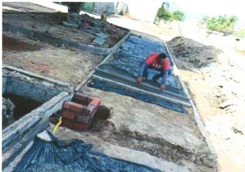
FOTO 02 – PAVIMENTAÇÃO EM CONCRETO, COM ESPESSURA DE 7CM, COM, ACABAMENTO FEITO UTILIZADO ALISADORA DE CONCRETO (HELICOPTERO), INCLUIDO TELA DE AÇO SOLDADA NERVURADA CA60, Q196 (3,11KG/M 2 ), DIAMETRO DO FIO 5.0 MM, LARGURA = 2,45 M, ESPAÇAMENTO DA MALHA 10CMX10CM