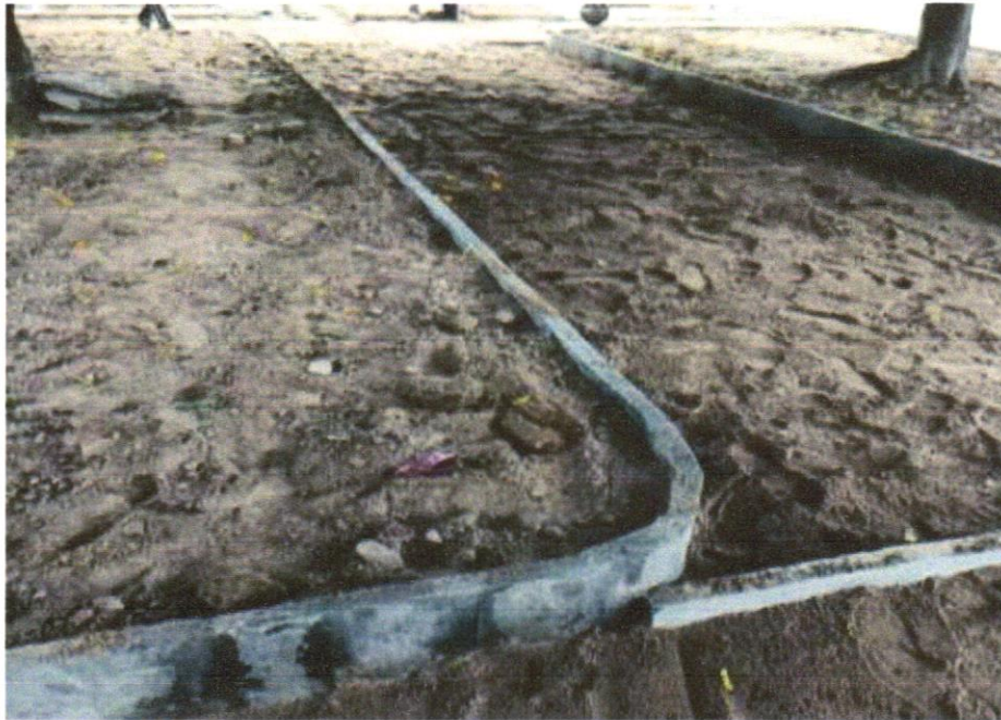
FOTO 05 – ASSENTAMENTO DE GUIA (MEIO-FIO) EM TRECHO RETO, CONFECCIONADA EM CONCRETO PRÉ-FABRICADO, DIMENSÕES 100X15X13X20 CM (COMPRIMENTO X BASE INFERIOR X BASE SUPERIOR X ALTURA), PARA URBANIZAÇÃO INTERNA DE EMPREENDIMENTOS