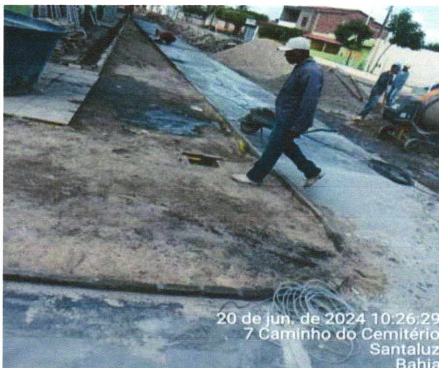
FOTO 04 - PAVIMENTAÇÃO EM CONCRETO, COM ESPESSURA DE 7CM, COM, ACABAMENTO FEITO UTILIZADO ALISADORA DE CONCRETO (HELICOPTERO), INCLUIDO TELA DE AÇO SOLDADA NERVURADA CA60, Q196 (3,11KG/M 2 ), DIAMETRO DO FIO 5.0 MM, LARGURA = 2,45 M, ESPAÇAMENTO DA MALHA 10CMX10CM