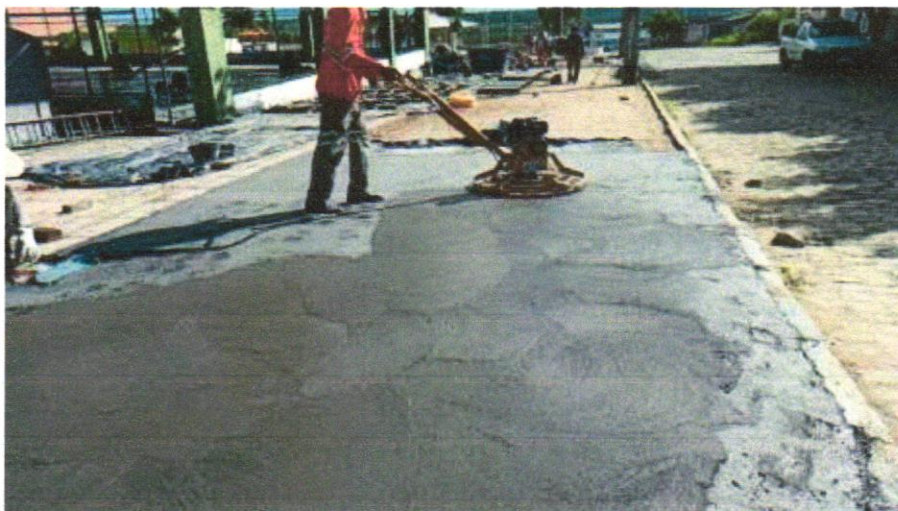
FOTO 03 - PAVIMENTAÇÃO EM CONCRETO, COM ESPESSURA DE 7CM, COM, ACABAMENTO FEITO UTILIZADO ALISADORA DE CONCRETO (HELICOPTERO), INCLUIDO TELA DE AÇO SOLDADA NERVURADA CA60, Q196 (3,11KG/M 2 ), DIAMETRO DO FIO 5.0 MM, LARGURA = 2,45 M, ESPAÇAMENTO DA MALHA 10CMX10CM